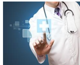
• МЕДИЦИНА ТА БІОЛОГІЧНІ НАУКИ