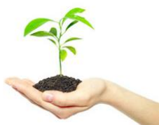
• ЧИСТІ ТЕХНОЛОГІЇ