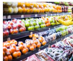
• ХАРЧУВАННЯ ТА С/Г